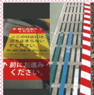
2019年2月施工：床デコポコシート 遠州鉄道第一通り駅様 (株)ミカド様