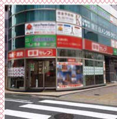
2019年3月施工：ガラスサイン 部屋セレブ覚王山店様