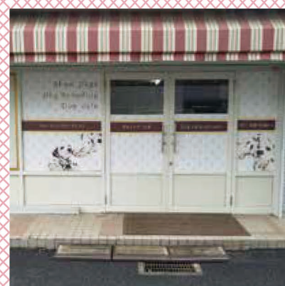
2019年3月施工：窓サイン Dalmatian犬舎・ドッグカフェ accueil様