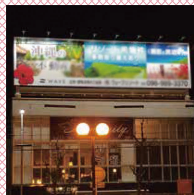
2019年2月施工：屋外サイン (株) ウェーブ様