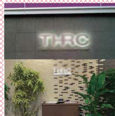
2019年3月施工：壁面サイン THRC様