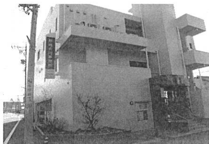
看板をつけた外観の様子。知性と誠実さを表す「青」は野崎合同事務所さまのイメージカラーだそうです。

登記・測量でご相談のある方は、一度『野崎合同事務所』を訪ねてみてはいかがでしょうか。